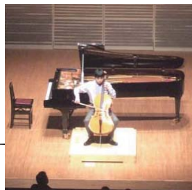
昨年度の演奏風景

地元で音楽を学んでいるジュニアたちによる発表コンサートです。長岡のこれからの音楽界を担っていくジュニアたちの、若々しくエネルギッシュな演奏をお楽しみください。